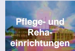
Pflege- und Reha- einrichtungen